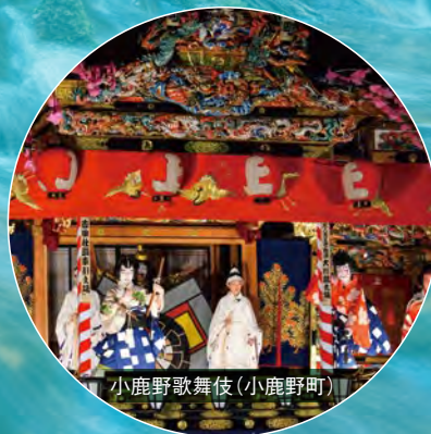
小鹿野歌舞伎 (小鹿野町)