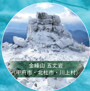
金峰山 五文岩 (甲府市・北社市・川上村)