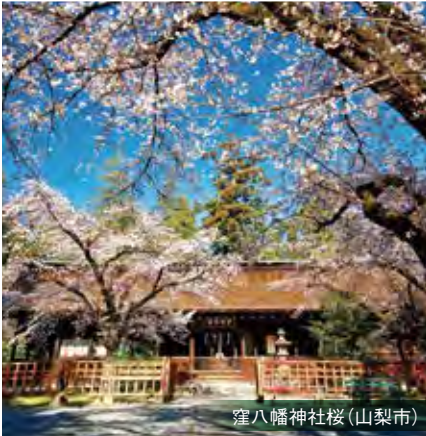
窪八幡神社桜(山梨市)