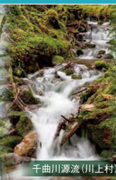
千曲川源流 (川上村)