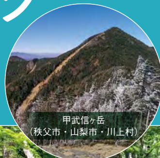
甲武信ヶ岳 (秩父市・山梨市・川上村)