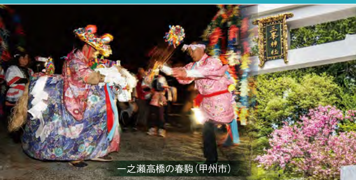
一之瀬高橋の春駒 (甲州市)