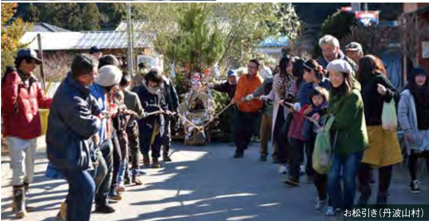
お松引き(丹波山村)