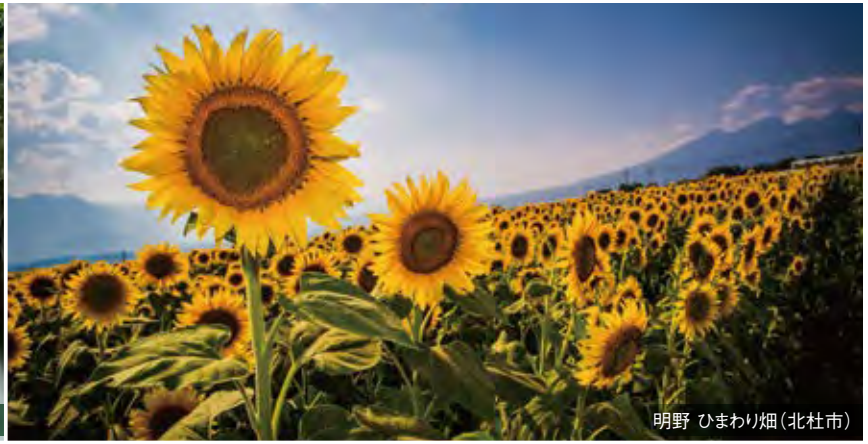
明野 ひまわり畑(北杜市)