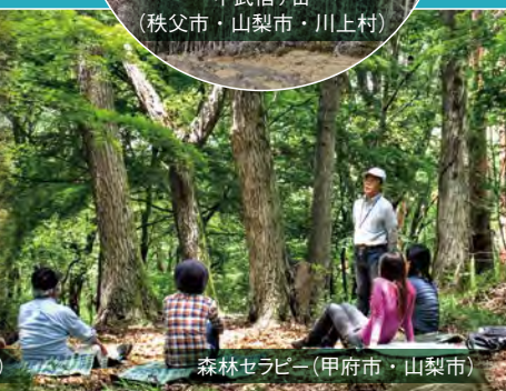
森林セラピー (甲府市・山梨市)