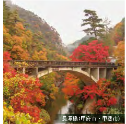
長潭橋(甲府市・甲斐市)